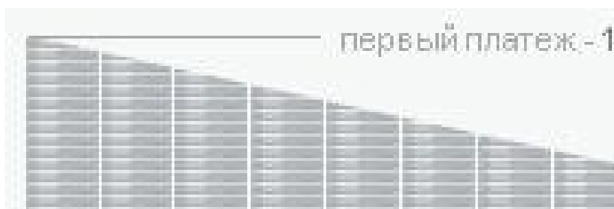
График погашения кредита дифференцированными платежами

Чтобы наглядно показать разницу в погашении кредита при разных методах начисления платежей, приведем графики погашения кредита в размере 1 000 000 руб., взятого на 20 лет при 12% годовых (серым выделена выплата процентов по кредиту, синим — выплата тела кредита).